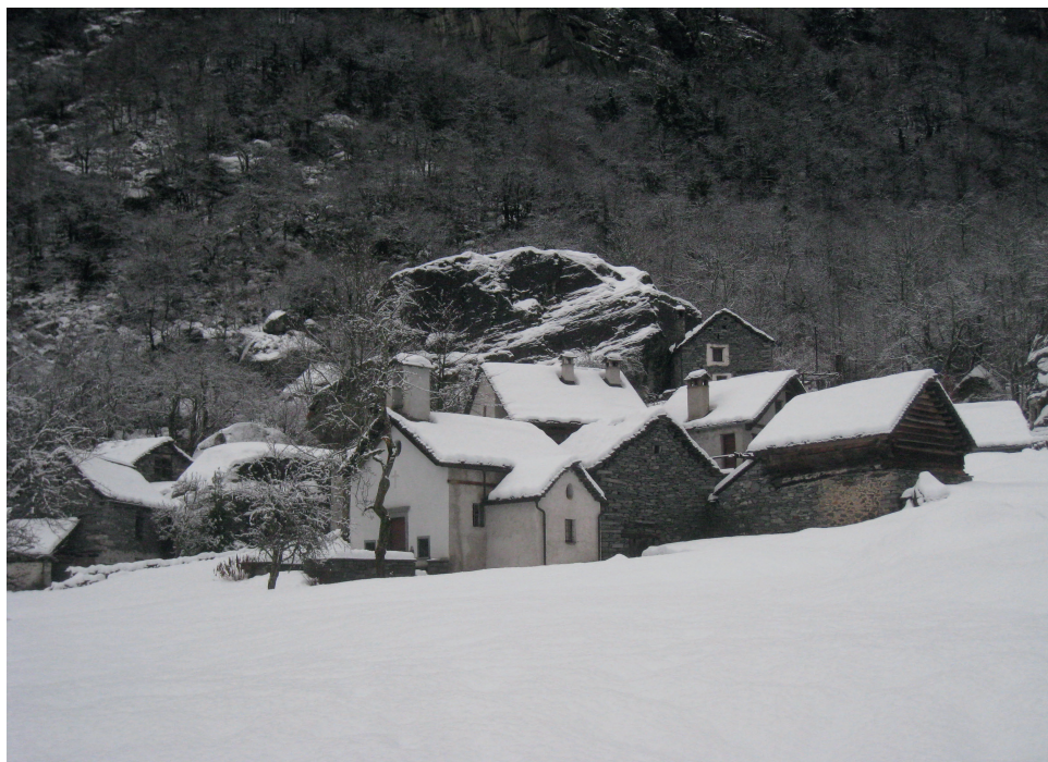
... und eine alte Siedlung, beide im Val Bavona.

Wie viele Expertisen zum Niedergang der peripheren Regionen wurden gemacht! Sie haben wenig oder nichts bewirkt, im Gegenteil. Auch die Regionalplanung hat, vorsichtig gesagt, relativ wenig gebracht; ich vermute, sie war zu rational und einseitig ökonomisch ausgerichtet. Sie hat wenig Enthusiasmus bewirkt. Das Problem war und ist, dass die Seele nicht einbezogen wurde. Die Seele ist die Kraft, die eine Brücke zwischen Tradition und Moderne bilden kann. Hat die heutige Politik verstanden, dass ohne Seele nichts geht? ●