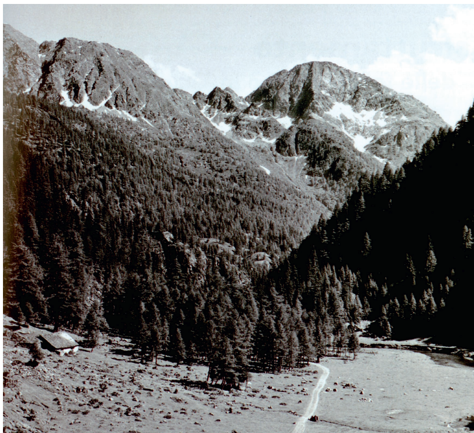
Das Valle Sambuco oberhalb Fusio im Jahr 1950, bevor es unter Wasser gesetzt wurde.

Wie alle Täler des Tessins hat sich auch das Maggiatal entvölkert. Seit 1850 haben die oberen Täler 55% (Val Lavizzara) bis 83% (Val Rovana) der Bewohner verloren. Die Bevölkerung des Ortes Campo Valle Maggia entspricht heute 12% der von 1850 und 5% von jener von 1680.